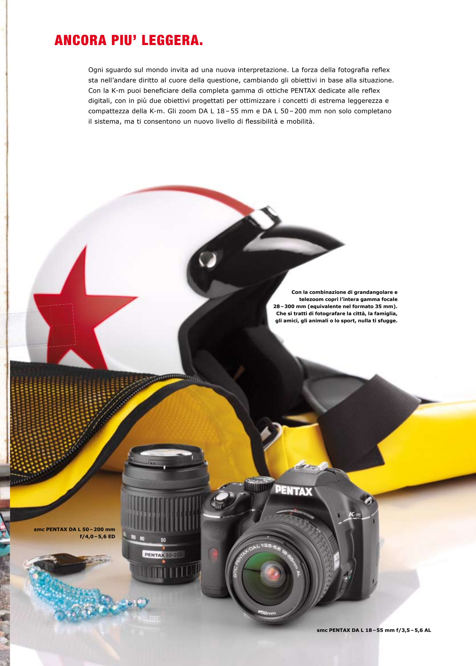
smc PENTAX DA L 50-200 mm f/4,0-5,6 ED